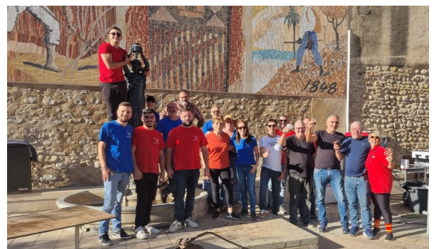
L'équipe qui a œuvrée pour cette journée

permis la bonne réalisation de cet évènement. Bravo aux grillardins et aux bénévoles pour l'organisation.