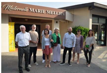
Visite de l'Inspectrice de l'Education Nationale Mme AGOSTINI