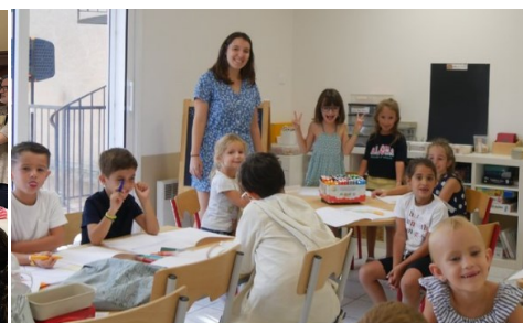
Aménagement d'une nouvelle classe à la Bressola.