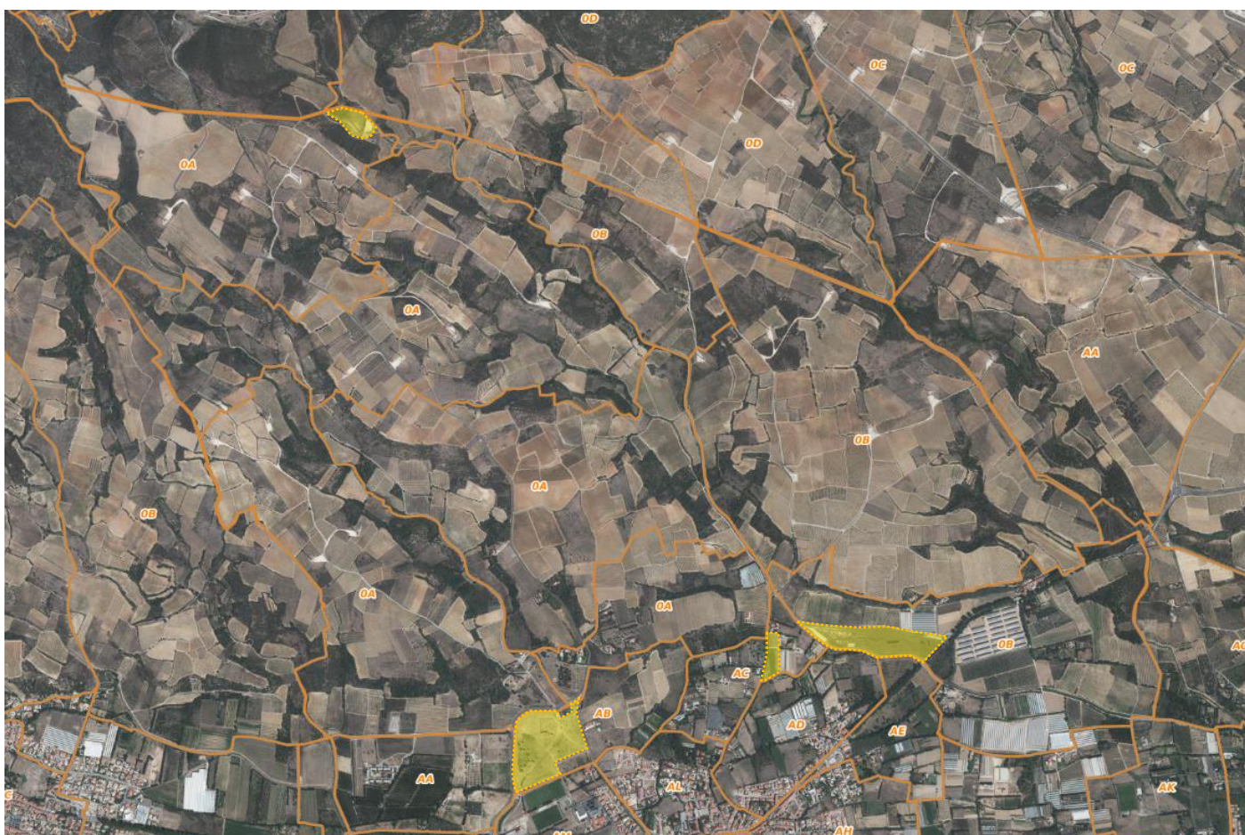
Les 3 bassins de rétention : El Torrents (B 1073 à 1085, B 1124 à 1128, B 1581 à 1582, B 1416, B 1089 à 1090, B 1387 à 1392), Berne (AB 1, 3, 4 et 6), Vigne d'en Désiré (A 1725 et 1729), ainsi que la parcelle AC 36